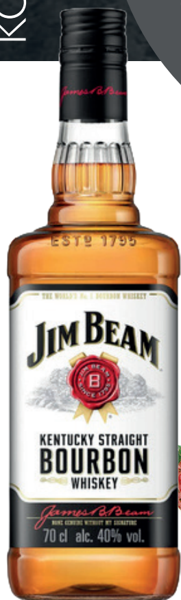
ВИСКИ JIM BEAM БУРБОН