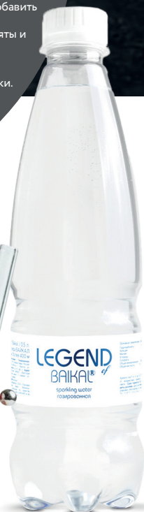
ВОДА ЛЕГЕНДА БАЙКАЛА