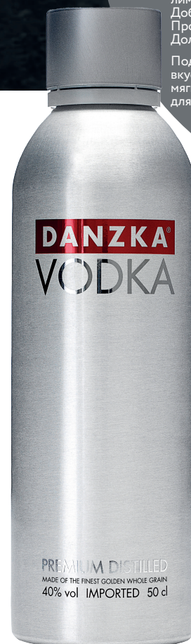
ВОДКА DANZKA VODKA