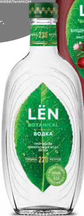
НАСТОЙКА СЛАДКАЯ LĒN вишня и миндаль