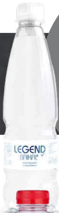
ВОДА ЛЕГЕНДА БАЙКАЛА